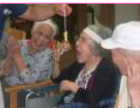
毎年恒例パン食い競争